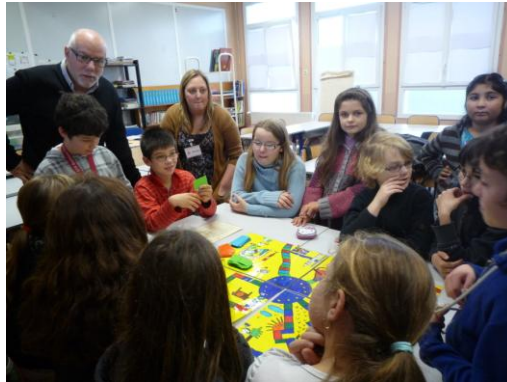
Foto 6 Spiele

Im Anschluss ging es daran probierten wir mit den Schülern der Grundschule die von Ihnen selbst zur Reise durch Europa erstellten Spiele aus. Dieser Kontakt zu den Kindern machte beiden Seiten viel Freude und wir konnten deren Arbeiten besonders wert schätzen.